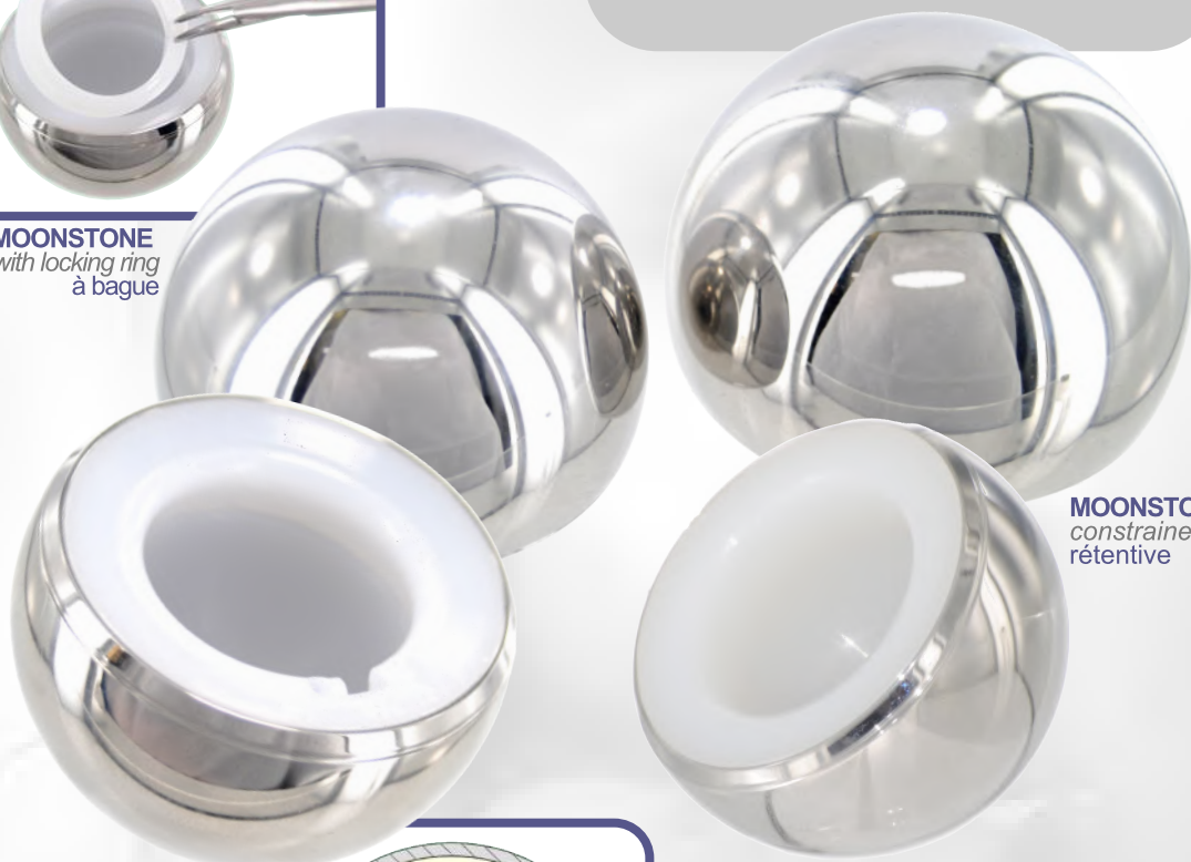
MOONSTONE constrained rétentive