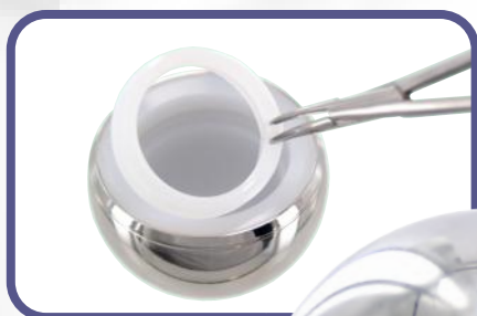
MOONSTONE with locking ring à bague